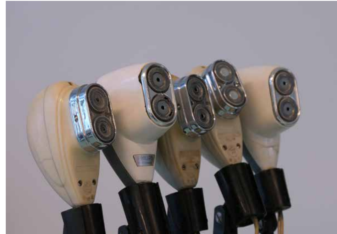
Hale Tenger, Oratör, 1992, Alüminyum levha, kapı kilidi, tıraş makinesi, mikrofon ayağı, 165x80x100 cm.

Buluntu objeleri işlerimin içine dahil ederek heykel ve duvar yerleştirmeleri üretiyordum. Kullandığım objelerin günlük hayatın pratiği içinde birer eşya olarak taşıdıkları anlamı dile dayalı kültürel yapılandırılmalar aracılığı ile dönüştürüyordum. Oratör bu tür çalışmalarımın tipik bir örneği.