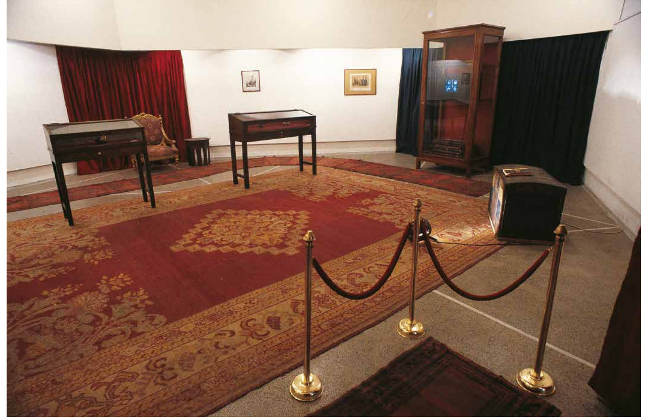
Hale Tenger, Havanın Lüzumu, 1992, Atatürk Kütüphanesi Sergi Salonu'nda mekâna özgü yerleştirme, İstanbul; Mobilya, halı, perde, kitap, kurutma kâğıdı, spekulum, üç maymun heykeli, litograf, televizyon ve sandık

2023 yılında Türkiye'de yaşadığımız genel seçim sürecinin bende bıraktığı hissiyat nedir sorusu aklımda dolarken karşınıza sizin işlerinizden biri çıktı: Al Birini Vur Ötekine . Bu ifade sanırım yalnızca Türkiye'nin içinde bulunduğu durumu değil dünya siyasetinin de vardığı durak noktasını özetliyor. Al Birini Vur Ötekine 'nin üretim sürecinden bahsetmek ister misiniz?