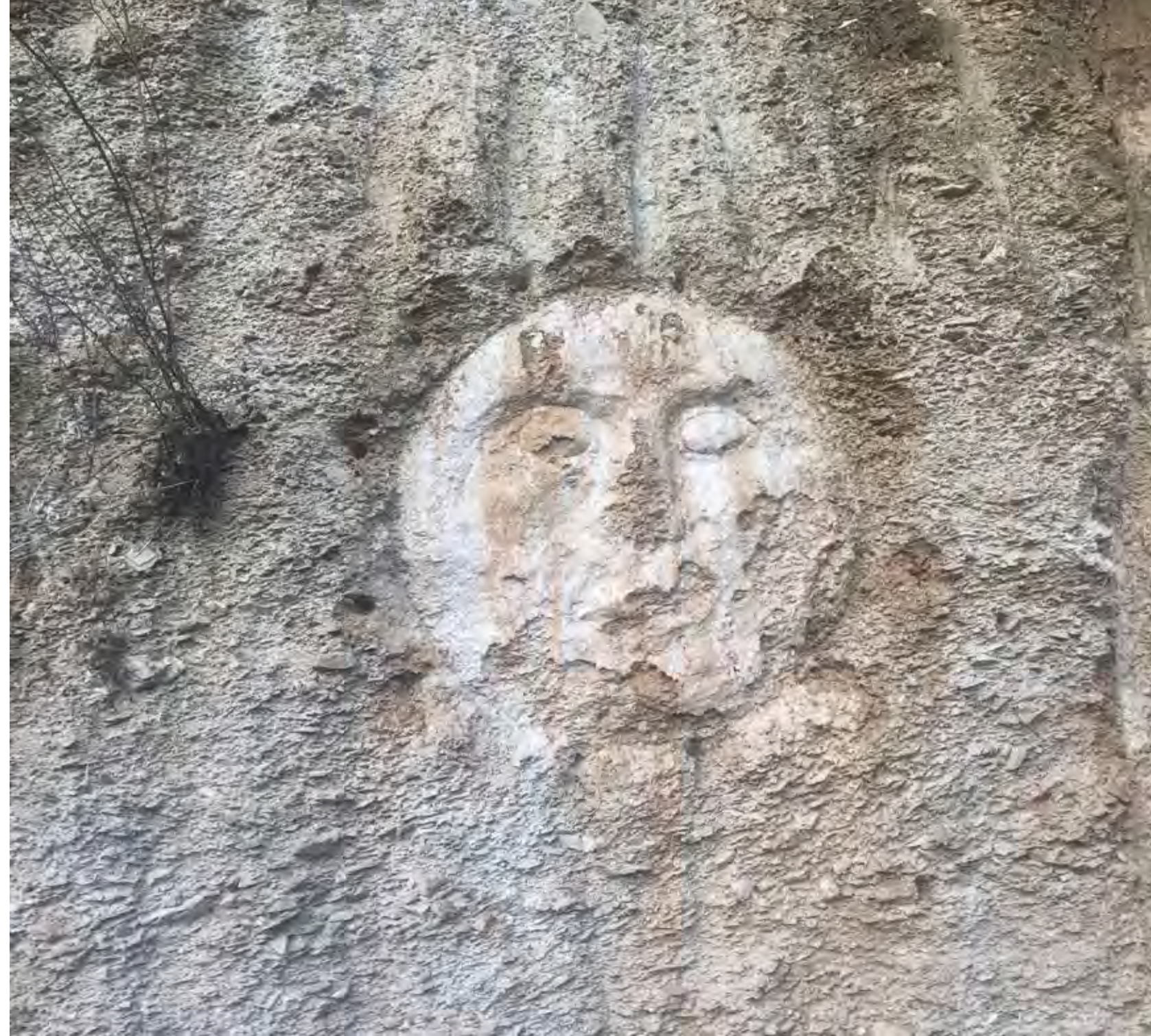
Can Serrat’ın bahçesindeki “ay yüz”, El Bruc, Katalonya.