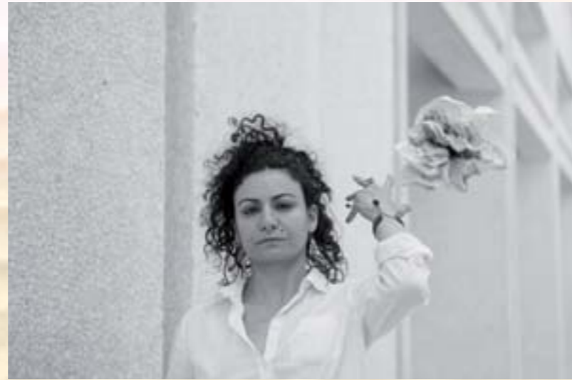
HALA OMRAN ATTRICE