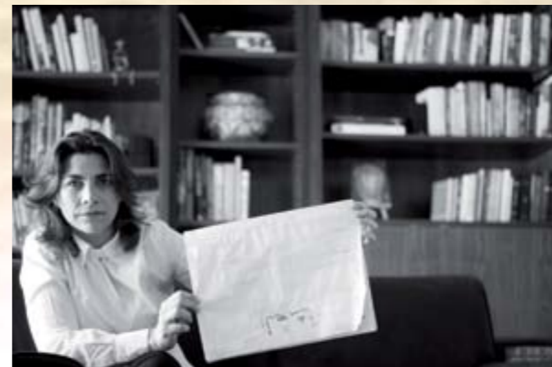
"THE ANONYMOUS ACTIVISTS"